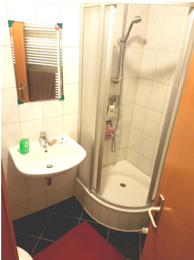
Ansicht im Bad