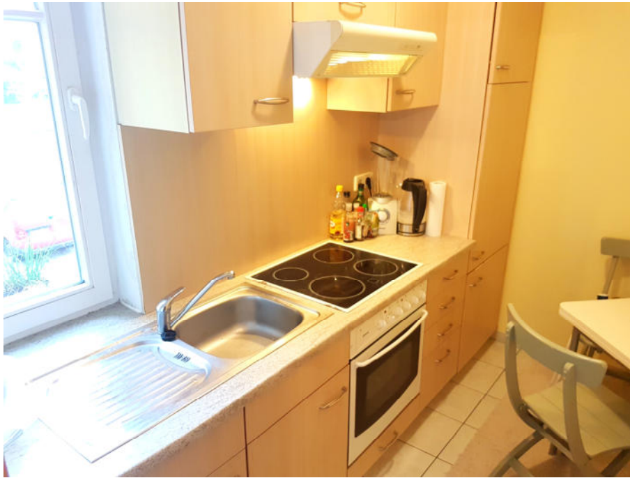
Ansicht der Küche